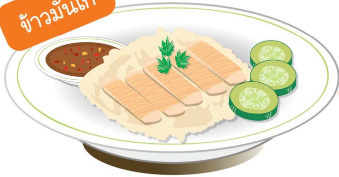
ข้าวมันไก่